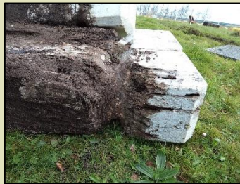
De ver ingevreten koppen van de houten kruipalen.